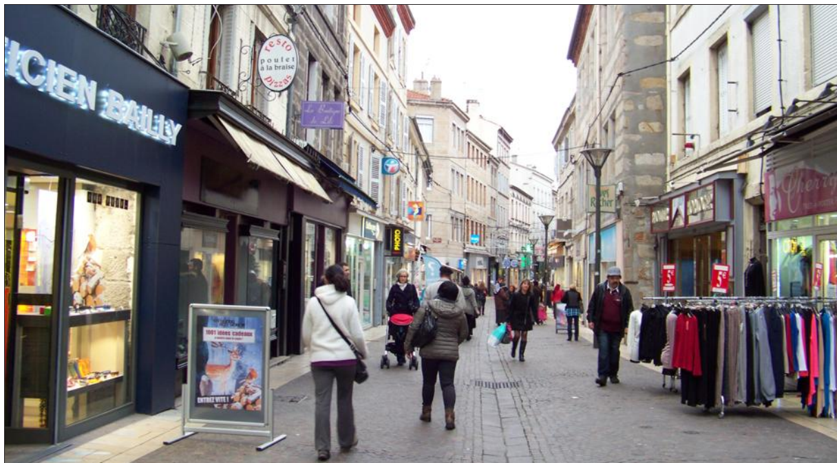
■ « Nous avons transmis à la mairie le résultat de notre enquête sur la rue de la République. »

« Essentiellement pour des problèmes de consommation, des problèmes de la vie courante. Ce sont, par exemple, des questions de malfaçons, de litiges entre voisins, de documents incompréhensibles pour certaines personnes. Et là, on se rend compte qu'il y a une rupture entre les différents organismes et les usagers. Le langage n'est pas le même et parfois il faut que nous aussi fassions un